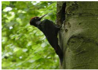
Picot Negre ( Dryocopus martius )