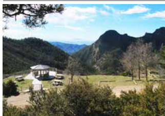
Mirador de Sant Romà