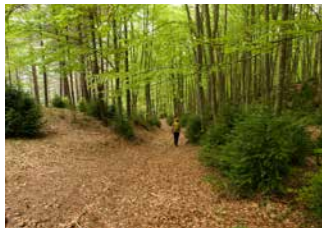
Fageda de les Collades