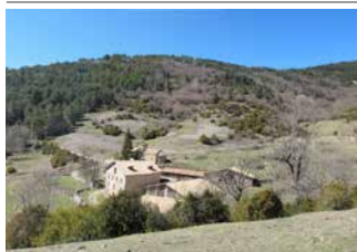
Sant Romà de la Clusa