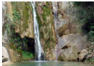
Saltant del barranc de l'Escalell