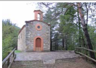
La Ribera - Ermita de Sant Ramon