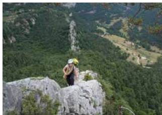
Cresta de la Clusa