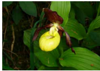
Esclops o Sabatetes de la Mare de Déu ( Cypripedium calceolus )