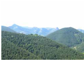
Sant Romà de la Clusa (s.XII)