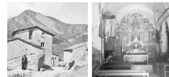
Inicis s. XX