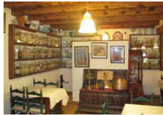
Anisoteca de Castell de l'Areny