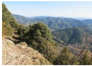
Tram del GR-4 pels Rocs de Castell